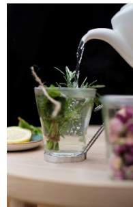
Marienkron