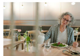
Marienkron Bilddownload