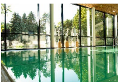
Marienkron Bilddownload