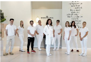
Therapie Team Marienkron