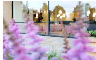
Marienkron