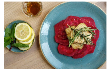
Marienkron