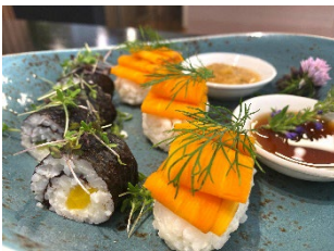
Marienkron Copyright @Sabine Hauswirth Bilddownload