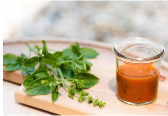
Marienkron